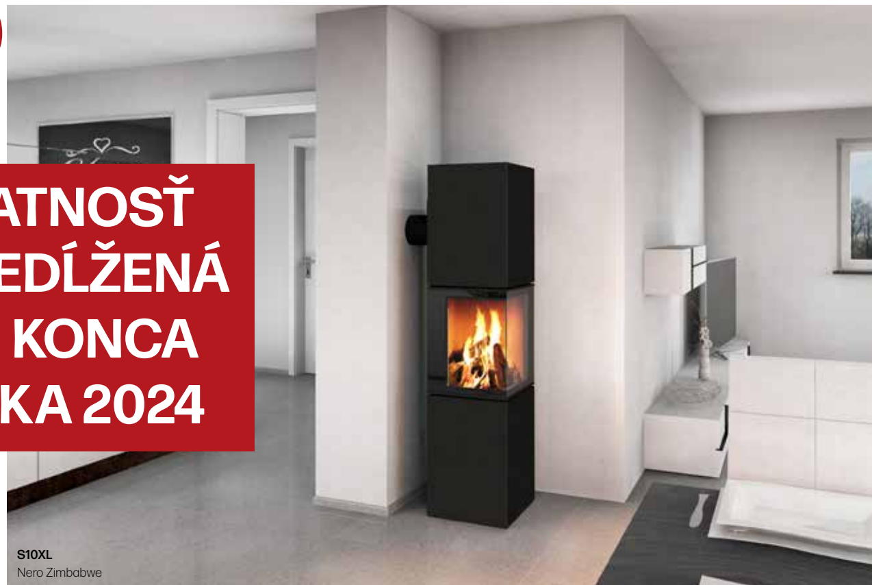
S10XL Nero Zimbabwe